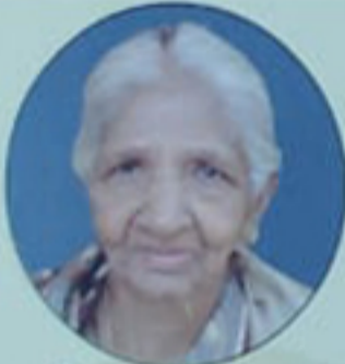
ചിന്നമ്മ (തേരപ്പു) പന്തപ്പാക്കൽ